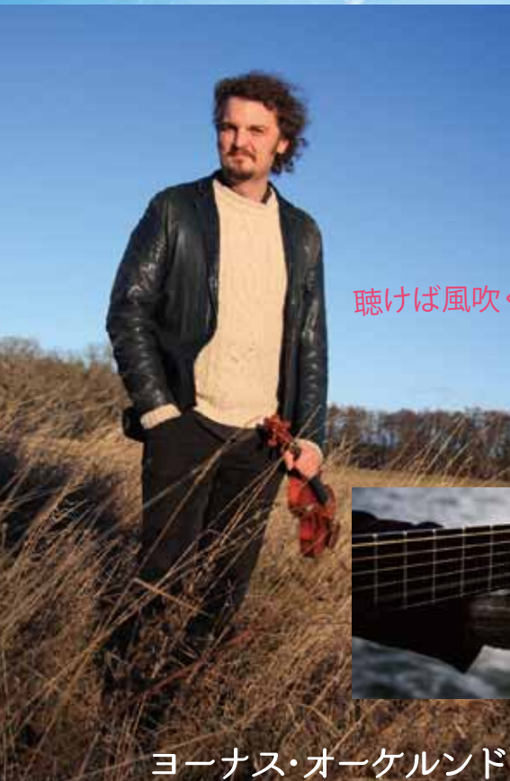
ヨナス・オーゲルンド

お手頃価格で上質な午後のひと時を愉しみたい方へ 夜のコンサートへ出掛けづらい方へ、びったりのコンサートです。