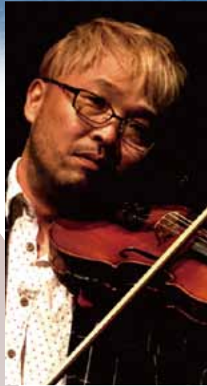
悠情 フィドル(ヴァイオリン) You Joe