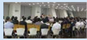
↑ Vol.1 10月19日開催