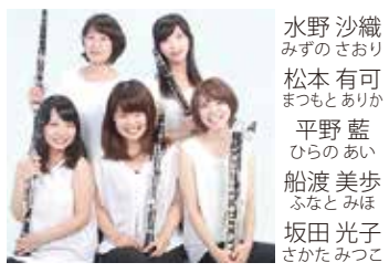
Clarinets Ensemble みたらしだんご

Vol.1719 3日(木・祝) クラリネットとダンス レハール/鈴木英史 編: 喜歌劇「メリー・ウィドウ」セレクション チャイコフスキー: バレエ音楽「白鳥の湖」より ピアノソラ: タンゴ組曲 他