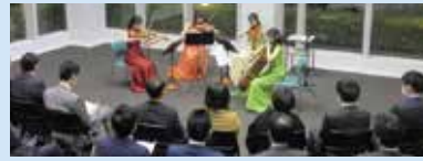
↑ Vol. 2 2016年12月7日開催

仕事を終えてからコンサートホールへ足を運ぶのはなかなか難しい…しかし、疲れた体に音楽で心の癒しが欲しい。そこで、クラシック音楽の生演奏をオフィスの中で聴いていただく!と、宗次ホールと企業がコラボし開催するコンサートです。クラシック音楽を広めるため、また、クラシック音楽を通して社内コミュニケーションの活性化を目指しています。コンサート開催希望の方は、担当(野間080-1557-7743)までご連絡ください。