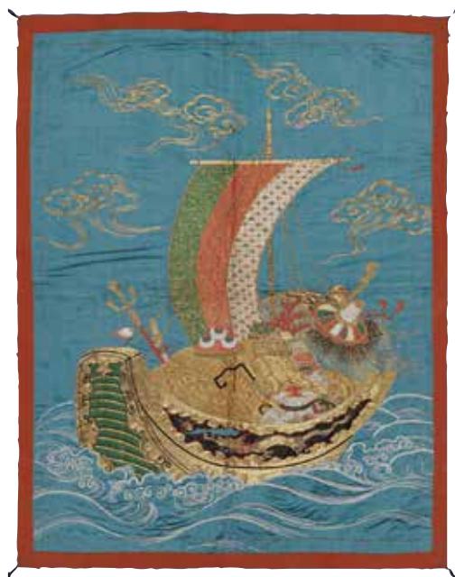
《浅葱縹子地宝船模様掛袱紗》(部分) 江戸時代・19世紀半ば

アメリカが世界に誇るボストン美術館のコレクションを、名古屋に居ながら鑑賞できる名古屋ボストン美術館はその使命を全うして、10月8日(月・祝)をもって閉館することとなりました。最終展「ハピネス～明日の幸せを求めて」に合わせ、宗次ホールでは、ファイナルコラボコンサートを開催いたします。初出展の作品、おなじみの作品等をスクリーンへ投影し音楽と共に楽しみいただきます。